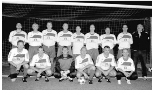
Die erfolgreichen Senioren des TSV Ottobrunn

Nach anfangs holprigem Start kommt die Erste Mannschaft immer besser in Tritt und hat den Anschluss zur Spitze wieder hergestellt. Die zweite Herrenmannschaft spielt nach zwei Aufstiegen in Folge schon wieder um die Meisterschaft in der A-Klasse. Die dritte Herrenmannschaft spielt ihre erste Saison und etabliert sich immer besser in ihrer Spielklasse der C-Klasse. Die eben in die Kreisliga aufgestiegene Damenmannschaft ist Tabellenzweiter und wahrt damit ihre Chancen auf den nächsten Aufstieg. Im Oktober schafften die Senioren den Aufstieg in die Kreisliga. Eine tolle Leistung, die zeigt, dass auch die älteren Fußballer zu außergewöhnlichen Leistungen fähig sind.