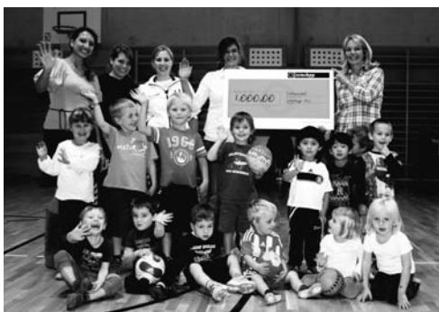
Scheckübergabe in der Neubiberger Halle